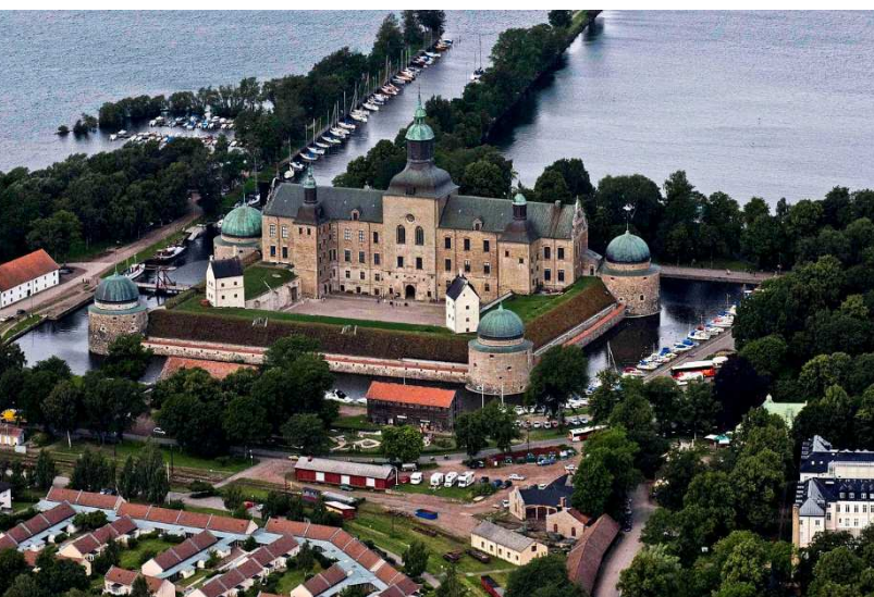
Vadstena slott med Riksarkivet i Vadstena